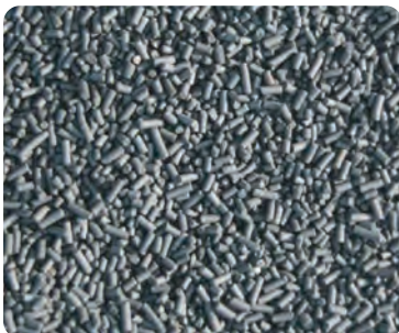
가공활성탄 흡착율이 우수하여 고농도 가스처리에 적합